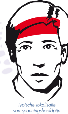
Typische lokalisatie van spanningshoofdpijn

Spanningshoofdpijn is de meest voorkomende vorm van hoofdpijn . Mannen en vrouwen worden er in gelijke mate door geplaagd. De pijn zit meestal aan beide kanten van het (voor)hoofd. Het voelt aan alsof er een strakke band om het hoofd zit.